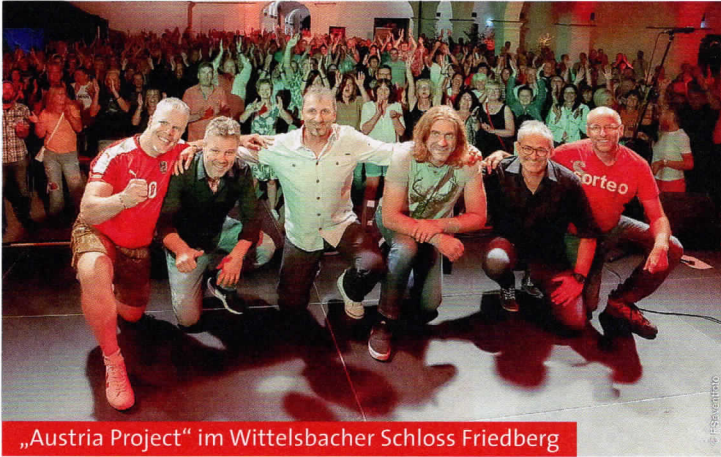
„Austria Project“ im Wittelsbacher Schloss Friedberg