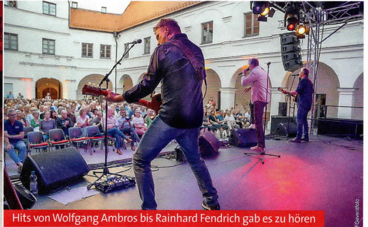
Hits von Wolfgang Ambros bis Rainhard Fendrich gab es zu hören